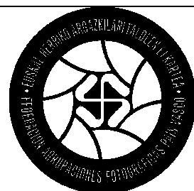
Federación agrupaciones fotográficas del País Vasco