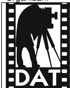
Derioko Argazki Taldea